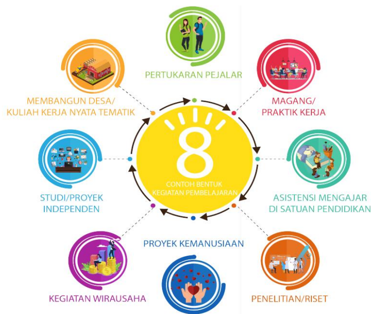
Gambar 3. Kegiatan pembelajaran sesuai Permendikbud No 3 Tahun 2020 Pasal 15 ayat 1

Selaras dengan pembelajaran Kampus Merdeka, kegiatan PKM diharapkan dapat memberikan kesempatan dan tantangan dalam pengembangan kreativitas, inovasi, dan kapasitas, serta kemandirian dalam mencari dan menemukan pengetahuan atau solusi melalui masalah dan dinamika yang ada di masyarakat. Penjelasan Rekomendasi konversi sks dapat dilihat di Buku Pedoman. Bentuk kegiatan pembelajaran yang sesuai adalah Studi/Proyek Independen seperti terlihat dalam Gambar 3.